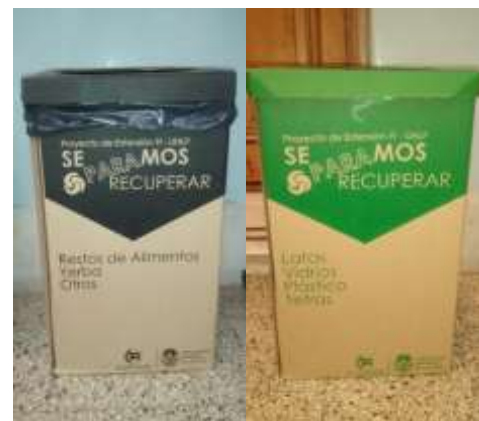
Fig. 2: Modelo de tachos provistos por el Taller Protegido Los Tilos

Con respecto a la implementación del PGIRSU y decidida las fracciones, se realizó la compra al Taller Protegido los Tilos de los recipientes de cartón destinados a la separación en origen.